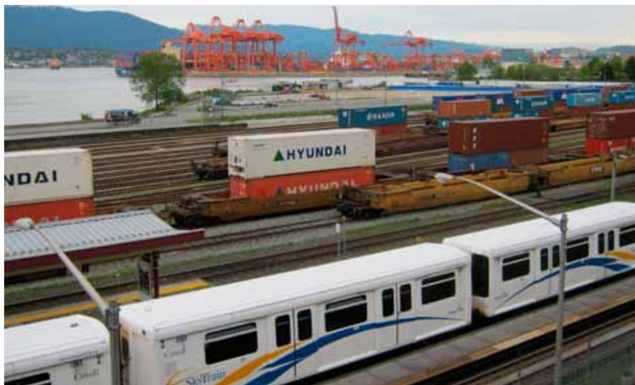
Vagões Double Stack no Porto Metro Vancouver, Canadá.

A ITRI Rodoferrovia, empresa associada à Câmara Brasileira de Contêineres Transporte Ferroviário e Multimodal, foi indicada a receber o prêmio Revista Ferroviária 2011 na categoria "cliente", com um case do modal shift.