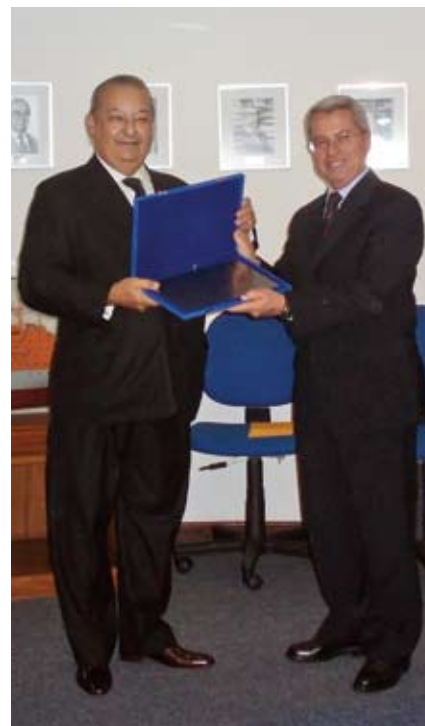
Presidente da CBC entrega placa ao Diretor de Portos e Costas, o mais novo Sócio Benemérito da entidade.

Confira a nova diretoria no expediente, na página quatro.